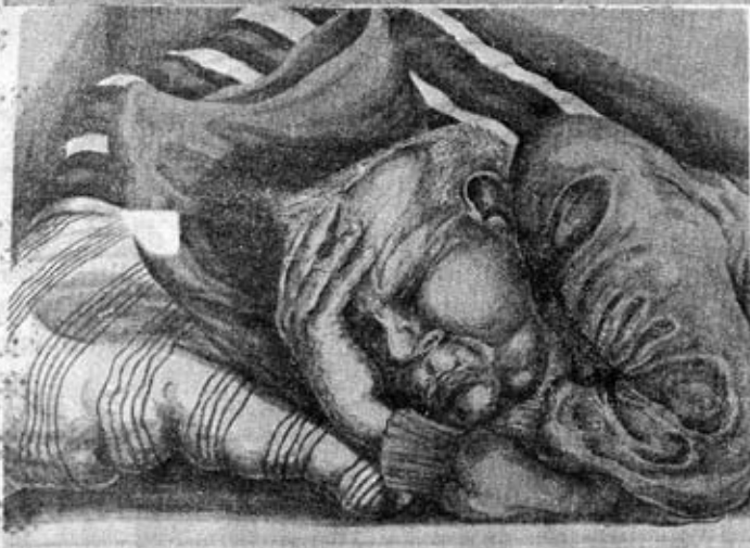
"Sovande". Färglitografi av Bernt Jonasson.

omsymbolseringen, som veritifierar den vakna och påtagliga verklighetens symbolik.